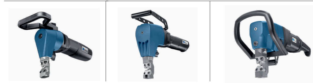
TruTool N 500