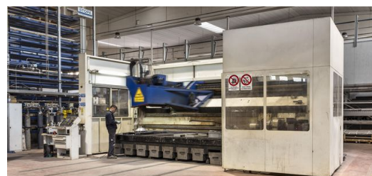
Multitalent: Mit der Lasercell 1005 schweißt und schneidet ELFIM nicht nur 2-D- und 3-D-Bauteile, sie eignet sich auch fürs Laserauftragschweißen.