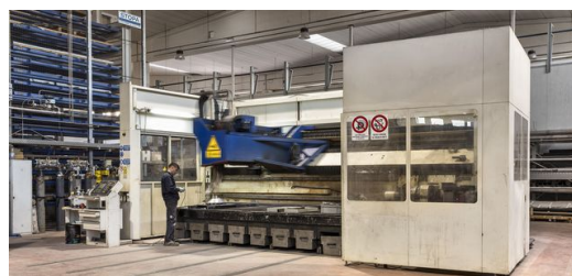
Multitalent: Mit der Lasercell 1005 schweißt und schneidet ELFIM nicht nur 2-D- und 3-D-Bauteile, sie eignet sich auch fürs Laserauftragschweißen.