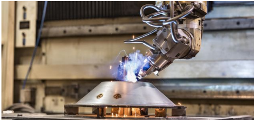
Die Laserzell 1005 nutzt Elfim für unterschiedliche Laseranwendungen wie 2- und 3-D-Schneiden und Schweißen aber auch für das LMD-Verfahren. Bild: Antonio & Roberto Tartaglione

Ersatzteile ein. Bild: Antonio & Roberto Tartaglione