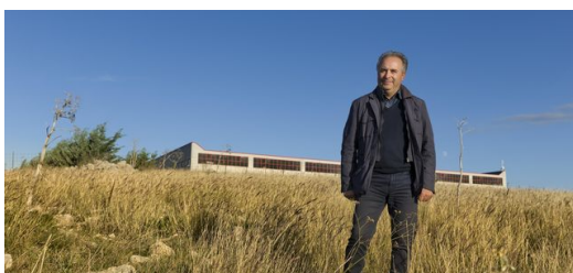
Das Unternehmen ELFIM S.r.l. befindet sich auf einer kargen Hochebene bei Gravina in Puglia.

Dabei handelt es sich fast immer um Einzelstücke, 12 Stück waren bisher das größte Los für ELFIM: „Mit dem LMD-Verfahren fertigen wir Komponenten, die sich entweder nicht anders herstellen lassen oder deren Produktion mit alternativen Verfahren bei so kleinen Losgrößen viel zu teuer wäre. Zum Beispiel weil man vorher erst aufwendig eine Gussform oder andere Werkzeuge bauen müsste“, erläutert D’Alonzo.