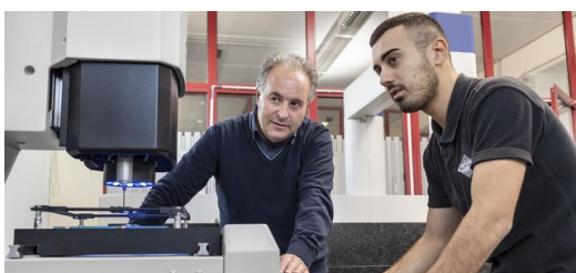
Ersatzteile für Oldtimer sind rar. Per LMD-Verfahren lassen sie sich kostengünstig rekonstruieren. Dafür scannen die Experten bei Elfim die