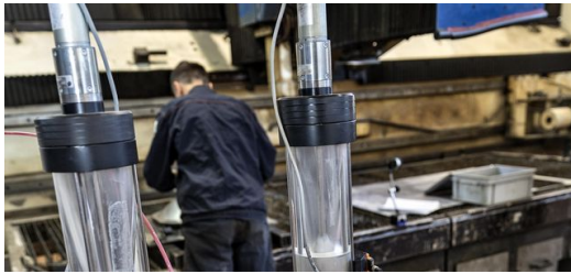
Zusammen mit einem Pulverförderer eignet sich die Lasercell 1005 von TRUMPF auch hervorragend fürs Laserauftragschweißen.

„LMD ist ja genau genommen nichts Neues – für die Reparatur und Beschichtungen wird das Verfahren schon seit vielen Jahren eingesetzt. Wir haben uns aber entschieden, das Verfahren dazu zu benutzen, komplette Bauteile herzustellen. Wie bei diesem Laufrad hier.“