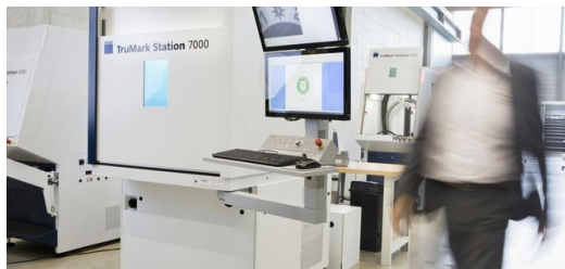
Die Editionsgravur für die Meister S Chronoscope Platin Edition 160 entstand in einer TruMark Station 7000, ausgestattet mit der neuen Generation TruMicro Mark Serie 2000 Ultrakurzpuls-Laser.

Klar, dass bei diesem Zeitmesser alles bis ins kleinste Detail perfekt sein muss. Gehäuse, Drücker und die verschraubte Krone der Meister S Chronoscope sind aus hochglänzendem poliertem Platin gefertigt. Der Stundenzähler der Stoppuhr, integriert im kühl silbrig schimmernden Zifferblatt, trägt ebenso die Limitierungsnummer wie der Uhrenboden. „Jede Uhr ist ein absolutes Unikat“, freut sich Stotz. „Die 12er-Nummerierung auf dem Zifferblatt und die Editionsgravur mit Limitierungsnummer auf dem Uhrenboden machen sie einzigartig. Damit auch dieses Alleinstellungsmerkmal perfekt wird, haben wir uns an unseren Ansprechpartner Ralf Motz von TRUMPF gewandt.“