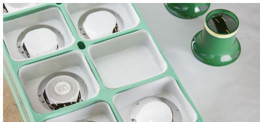
Bei der neuen Generation der Ultrakurzpuls-Laser TruMicro Mark Serie 2000 lässt sich die Pulsdauer zwischen 400 Femtosekunden und 20 Pikosekunden variabel einstellen. Das ermöglicht eine schnelle gratfreie und jederzeit in gleichbleibender Qualität reproduzierbare Gravur bis zu 100 Mikrometer Tiefe in allen Edelmetallen.