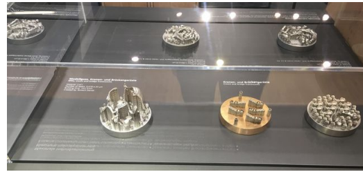
Substratplatten mit 3D-gedrucktem Zahnersatz.