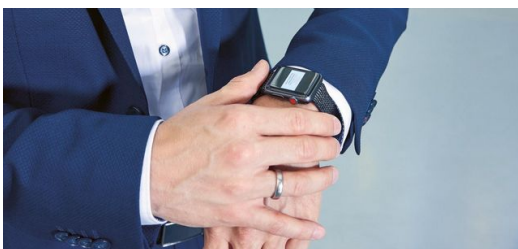
In der Smart Factory sind alle Mitarbeiter mit mobilen Endgeräten ausgestattet: Eine Smart Watch informiert sie über den Zustand der