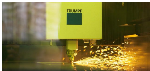
Seit März machen die Mitarbeiter bei FBT den Zuschnitt von Dünnblech und Platinen mit ihrer neuen TruLaser 3030.