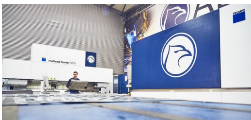
<p>Modernerste Technologie: Arbeiter mit der TruBend Center 5030</p>