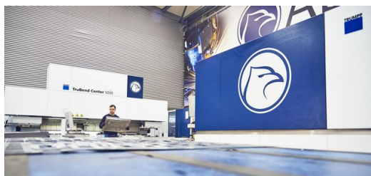
Modernste Technologie: Arbeiter mit der TruBend Center 5030