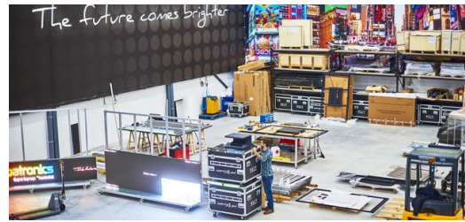
<p>Individuell: Apametal entwickelt und baut jedes digitale Schild selbst.</p> <p>– Frederik Dulay-Winkler</p>