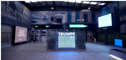
<p>Authentisch: Kopfsteinpflaster im Showroom soll für eine realitätsnahe Atmosphäre sorgen.</p> <p>– Frederik Dulay-Winkler</p>