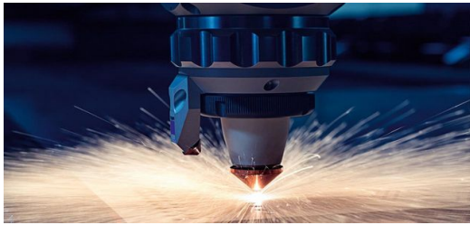
Zwischen Daten und Form steht nur ein gebündelter Lichtstrahl. Und der kann alles: abtragen, auftragen, bohren, trennen, fügen und vieles mehr.