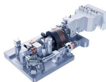
Der TruDisk Scheibenlaser gilt als fortschrittlichster High-Power-Festkörperlaser auf dem Markt.