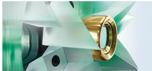
Blick in den Laserresonator: Die Umlenkspiegel in der Kavität lenken den Pumpstrahl, der von den Dioden kommt, mehrmals durch den Scheibenkristall. So entsteht ein gebündelter Laserstrahl.