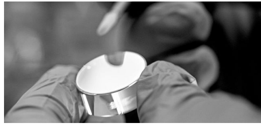
Hier wird ein optisches Element gereinigt. Viele hochspezialisierte Bauteile wie Linsen, Dioden oder Strahlführungskomponenten arbeiten in einer Laserstrahlquelle zusammen.