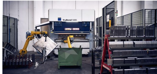
Kollege Roboter: Für die Mitarbeiter bei Omas S.p.a. gehören die Roboter schon längst zum Alltag.