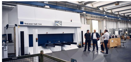
Die TruLaser Cell 7040 in der Produktionshalle von Omas S.p.a.