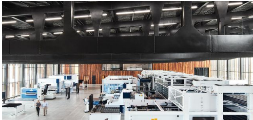
In einer 55 Meter langen Produktionshalle befindet sich eine verkettete Blechfertigung mit einem Hochregallager als Herzstück, das die daran angebundenen Werkzeugmaschinen mit Material versorgt.