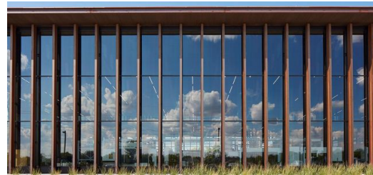
Im Fokus der Smart Factory stehen Beratung und Training der Kunden bei der Einführung von digital vernetzten Fertigungslösungen.