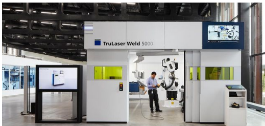
Die Fertigungslinie ist so aufgesetzt, dass sich komplette reale Produktionsprozesse durchführen lassen.