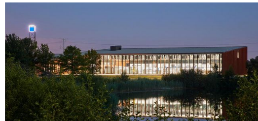
Die Investitionssumme für den 5.500 Quadratmeter großen Standort lag bei 13 Millionen Euro. verantwortlich für den Entwurf des Gebäudes zeichneten Barkow Leibinger Architekten aus Berlin.