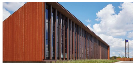
Im Gebäude treffen die Geschichte des „Rust Belt“ als ältester und größter Industrieregion der USA und digital vernetzte High-Tech-Produktion aufeinander.