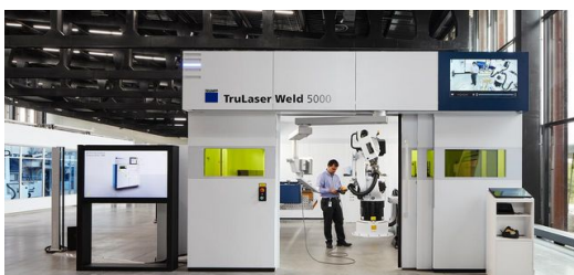
Die Fertigungslinie ist so aufgesetzt, dass sich komplette reale Produktionsprozesse durchführen lassen.