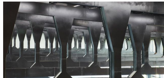
Der Skywalk ist Teil der frei tragenden Deckenstruktur aus Stahl, die von einem TRUMPF Kunden in Atlanta gefertigt wurde.