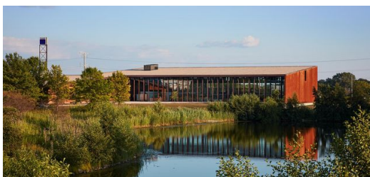
Der Standort Chicago ist für die Smart Factory wie geschaffen. Rund 40 Prozent der blechbearbeitenden Industrie in den USA befinden sich in den direkt umliegenden Staaten.

Wenn „Show“ und „Fabrik“ zusammenkommen, entsteht garantiert etwas Anschauliches. TRUMPF hat es damit einmal mehr besonders weit getrieben. Die im September 2017 eröffnete Showfabrik in Chicago schafft es nicht nur, die digitale Vernetzung greifbar zu machen, sondern sieht auch noch futuristisch aus und vermittelt einzigartige Perspektiven: Mit zahlreichen teils transparenten Bildschirmen und direktem Blick auf den Shopfloor bietet ein Kontrollraum die volle Übersicht über alle Maschinen. Ein Gang in luftiger Höhe, der die gesamte Produktionshalle überspannt, macht die verketteten Produktionsanlagen von oben transparent. Die Smart Factory in Chicago zeigt, was heute in der Blechfertigung mit modernsten Mitteln möglich ist. Es geht nicht wie in anderen Vorführzentren um einzelne Produkte, sondern um das ganzheitliche Zusammenspiel in der Fertigung. Deshalb bildet Chicago die komplette Wertschöpfungskette der Kunden ab und ermöglicht es ihnen sogar, eigene Aufträge einzulasten.