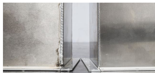
Werner Neumanns Erwartungen in punkto reduzierter Nacharbeit hat das Laserschweißen voll und ganz erfüllt. Bei manchen Teilen konnte er sie von zwölf auf eineinhalb Stunden reduzieren.