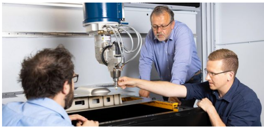
<p>Miteinander diskutieren, streiten und gemeinsam Lösungen suchen: die gute Zusammenarbeit zwischen Söhnen und Vater hat das Unternehmen weit vorangebracht, mit Kurs auf die Smart Factory.</p>