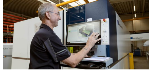
Eine TruLaser 3030 wird mit einem LiftMaster teilautomatisiert be- und entladen.