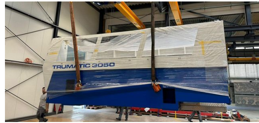
Schwere Fracht: Die sieben Tonnen schwere Bar bei der Ankunft in der Montagehalle der Firma Matyssek Metalltechnik.