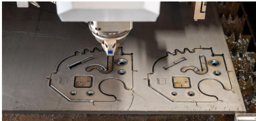
Das Bauteil wurde noch auf der Standardmaschine fürs Laserschweißen angefast. Damit spart TRUMPF aufwendige Folgeprozesse ein.