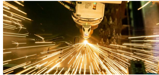
Der Laser einer TRUMPF Schneidmaschine erzeugt schräge Schnittkanten an den Konturen des Bauteils, sogenannte Fasen.