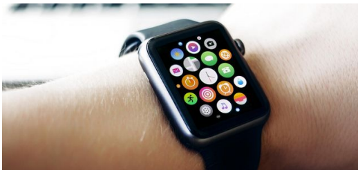
Die Smart Watch ist ein weiterer intelligenter Alltagsbegleiter.

Diese neue Glasschneidemethode bietet dabei nicht nur die Chance, die heutige industrielle Displayproduktion von teuren Zwischenschritten zu befreien. Auch die Prozessreihenfolge ließe sich neu anordnen: Weil der Laser gehärtete Gläser schnell und nachbearbeitungsfrei zerlegt, könnten künftig die üblichen Bearbeitungsschritte — Härten, Beschichten und Strukturieren — am großen Werkstück ausgeführt werden. Erst am Schluss zerteilt der Laser dann die große Scheibe.