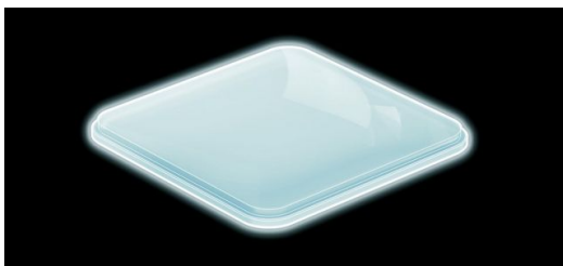
Saphir-Kameraabdeckung: Ultrakurze Pulse schneiden extrem harte Saphirplättchen, die als Schutz für die Smartphone-Kamera dienen. Seit Neuestem auch einbauoptimiert mit gestufter Schnittkante.