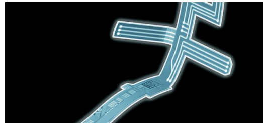
Folienleiterplatte: Laserlicht schneidet die flexiblen Folienleiterplatten in die richtige Form. Pikosekundenpulse bohren die Löcher, mit denen die Leiterbahnen übereinanderliegender Ebenen kontaktiert werden.