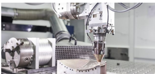
Die hier gezeigte LMD-Technologie eignet sich in der Luft- und Raumfahrt für die Reparatur großer Bauteile.