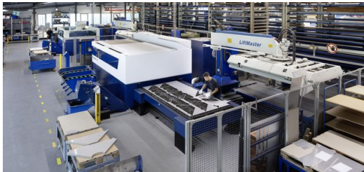
Die Maschinendatenerfassung ist eine wichtige Grundlage des Shopfloor-Managements bei WECUBEX. Beides zusammen hat dem Unternehmen im Jahr 2017 eine rund 10-prozentige Produktivitätssteigerung gebracht.“