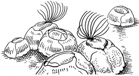
<p>Seepocken (Balanidae) sind Rankenfüßer, die zur Gruppe der Krebstiere gehören. Die sessilen Tiere leben vor allem in Küstengewässern, manche Arten auch in tieferen Regionen. Mit ihren Borsten fischen sie nach Mikroorganismen und Schwebeteilchen.</p> – Jürgen Willbarth / Die Illustratoren

Oberflächen ist das ein Ansatzpunkt. Die Haut des Haifisches hingegen hat man bislang vor allem wegen ihrer günstigen Hydrodynamik untersucht. Für unsere Zwecke interessanter ist, dass ihre Oberflächentopografie es Mikroorganismen nicht erlaubt, sich anzuhaften.