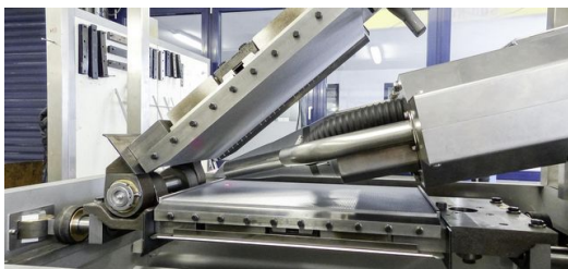
Trotz wenig Platz zwischen den Backplatten reinigt der Laser diese schnell und zuverlässig.