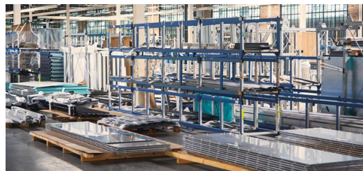
Alles aus einer Hand: Seit 2017 besitzt KFK eine eigene, ca. 360 Meter lange Glasfertigung.