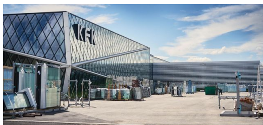
<p>Das KFK Gebäude in Kroatien.</p> – Frederik Dulay-Winkler

Früher fertigte KFK hauptsächlich für Kunden aus Kroatien. Heute ist das Unternehmen auf der ganzen Welt tätig. „Unser Fokus liegt im Moment auf dem Vereinigten Königreich, dort herrscht ein Bauboom. Immer höhere, immer raffiniertere, immer bessere Gebäude entstehen in allen Metropolen dieser Welt und London ist da keine Ausnahme“, so Papac. Er berichtet – nicht ohne Stolz – von KFKs derzeit größtem Projekt: „Wir arbeiten gerade an einem Wohngebäude in London. Es ist das höchste sich im Bau befindliche Wohngebäude Europas – mit 233 Metern Höhe und 76 Stockwerken. Das bedeutet natürlich auch, dass sehr viele Fassadenelemente gefertigt werden müssen.“ Bis ein solches Mammutprojekt fertiggestellt ist, dauert es mehrere Jahre. In diesem Fall sind es dreieinhalb.