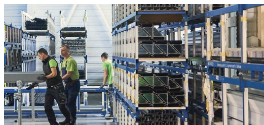
Neue Lösungen: Für ihre speziellen Aufträge muss KFK immer einen Schritt weiterdenken und flexibel agieren.