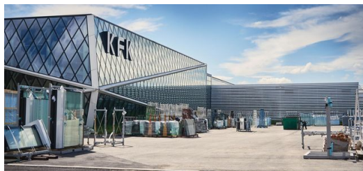
Das KFK Gebäude in Kroatien.

Früher fertigte KFK hauptsächlich für Kunden aus Kroatien. Heute ist das Unternehmen auf der ganzen Welt tätig. „Unser Fokus liegt im Moment auf dem Vereinigten Königreich, dort herrscht ein Bauboom. Immer höhere, immer raffiniertere, immer bessere Gebäude entstehen in allen Metropolen dieser Welt und London ist da keine Ausnahme“, so Papac. Er berichtet – nicht ohne Stolz – von KFKs derzeit größtem Projekt: „Wir arbeiten gerade an einem Wohngebäude in London. Es ist das höchste sich im Bau befindliche Wohngebäude Europas – mit 233 Metern Höhe und 76 Stockwerken. Das bedeutet natürlich auch, dass sehr viele Fassadenelemente gefertigt werden müssen.“ Bis ein solches Mammutprojekt fertiggestellt ist, dauert es mehrere Jahre. In diesem Fall sind es dreieinhalb.