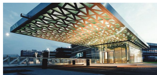
Haupteingang und Empfang: Der Blick zur Decke genügt – Besucher erkennen gleich, dass sich mit TRUMPF Maschinen Bleche lasern lassen.