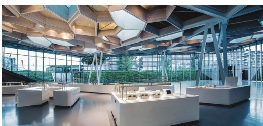
Begegnungsstätte: Der Blautopf ist mehr als nur ein Betriebsrestaurant.