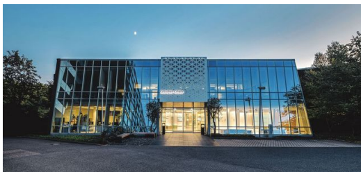
Kundenzentrum: Eine schöne Industriearchitektur in Kombination mit einer hohen Produktqualität soll die TRUMPF Kunden überzeugen.