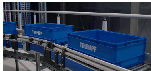
Die ersten Meter auf dem Weg zum Kunden: Die Kunststoffbehälter haben bis zu vier Einsatzkästen für Kleinteile.