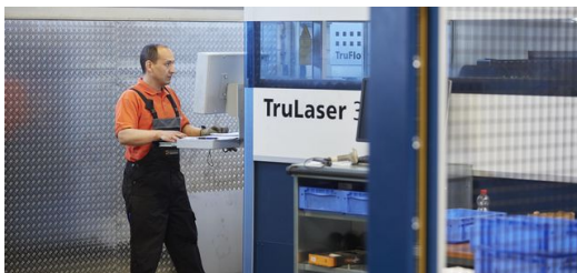
Der PalletMaster Tower wird mit der Standardsoftware der Maschine programmiert und die Bedienung ist einfach.

Neben Schnelligkeit, Flexibilität und Prozesssicherheit entlastet das automatisierte Be- und Entladen des Materials tagsüber auch den Bediener und sorgt für mehr Arbeitssicherheit. „Nachts fahren wir komplett mannlos und in den Tagesschichten sorgt der Tower dafür, dass sich meine Mitarbeiter nicht mehr mit den schweren unhandlichen Großformatblechen abmühen müssen.