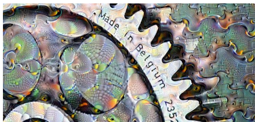
Der Traum im Werkstück?

Hinzu kommt, dass Laser, ausgestattet mit einem Rucksack voller Sensoren, Unmengen an Daten produzieren, die immer wertvoller werden. Mit menschlichem Erfahrungswissen trainierte Algorithmen werden in diesem Wust immer wieder neue Muster erkennen, die ein Mensch unmöglich sehen kann, und ihre Schlüsse daraus ziehen. Solche KI-Systeme werden genau in dieser Sekunde überall auf der Welt entwickelt. Sie werden nach und nach sowohl die Lasermaterialbearbeitung verbessern als auch die Laser selbst. Wie bei den Schachspielern von heute werden Laseranwender in zehn Jahren die besten Laseranwender aller Zeiten sein – und ihre KI lieben gelernt haben.