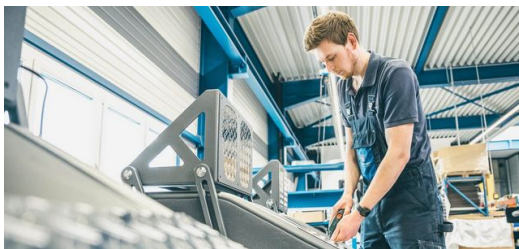
<p>Die Aluminium-Riffelbleche für die EGYM-Geräte schneidet und formt die TruMatic 7000 kratzerfrei und in bester Qualität.</p>

unser fundiertes Know-how im Bereich Laser-Rohrschneiden ganz besonders geholfen.“ Das Gestänge des Geräterahmens besteht zu 70 Prozent aus optisch attraktiven Ovalrohren aus stabilem Baustahl. „Wir setzen zur Bearbeitung sowohl unsere TruLaser Tube 5000 als auch unsere TruLaser Tube 7000 ein. Beide sind mit der Option Schrägschnitt ausgestattet und können Gewinde einbringen.“ Was bei der konventionellen Fertigung nur in mehreren Arbeitsschritten umsetzbar wäre, schaffen die Laser-Rohrschneidmaschinen von TRUMPF in nur einem Arbeitsgang. Das Riffelblech aus Aluminium zum Abstellen der Füße kommt kratzerfrei aus der TruMatic 7000 , die erforderliche Biegekante zur Befestigung am Rahmen erledigt die TruBend 7036 Cell . Die Elektronik sowie einige Kunststoffteile werden Steinhart zugeliefert. Nach der Pulverbeschichtung der Rahmen erfolgt die Montage aller Komponenten zu kompletten Einheiten.