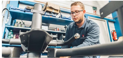
Das Gestänge eines EGYM-Fitnessgeräts besteht aus überwiegend ovalen Stahlrohren. Nach der Bearbeitung auf einer TRUMPF Laser-Rohrschneidmaschine bekommt es durch Pulverbeschichtung ein edles dunkelgraues Finish.