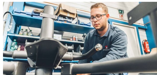
<p>Das Gestänge eines EGYM-Fitnessgeräts besteht aus überwiegend ovalen Stahlrohren. Nach der Bearbeitung auf einer TRUMPF Laser-Rohrschneidemaschine bekommt es durch Pulverbeschichtung ein edles dunkelgraues Finish.</p>