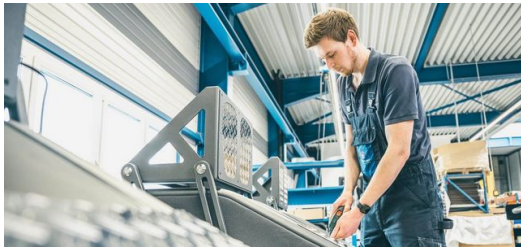
Die Aluminium-Riffelbleche für die EGYM-Geräte schneidet und formt die TruMatic 7000 kratzerfrei und in bester Qualität.

unser fundiertes Know-how im Bereich Laser-Rohrschneiden ganz besonders geholfen.“ Das Gestänge des Geräterahmens besteht zu 70 Prozent aus optisch attraktiven Ovalrohren aus stabilem Baustahl. „Wir setzen zur Bearbeitung sowohl unsere TruLaser Tube 5000 als auch unsere TruLaser Tube 7000 ein. Beide sind mit der Option Schrägschnitt ausgestattet und können Gewinde einbringen.“ Was bei der konventionellen Fertigung nur in mehreren Arbeitsschritten umsetzbar wäre, schaffen die Laser-Rohrschneidmaschinen von TRUMPF in nur einem Arbeitsgang. Das Riffelblech aus Aluminium zum Abstellen der FüÙe kommt kratzerfrei aus der TruMatic 7000 , die erforderliche Biegekante zur Befestigung am Rahmen erledigt die TruBend 7036 Cell . Die Elektronik sowie einige Kunststoffteile werden Steinhart zugeliefert. Nach der Pulverbeschichtung der Rahmen erfolgt die Montage aller Komponenten zu kompletten Einheiten.