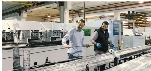
Hydracorte ist Teil der Caamaño Group, einem globalen Netzwerk von Unternehmen, das auf den Bau, die Sanierung und Einrichtung von Shops spezialisiert ist. Hydracorte steht als Metallteile-Lieferant am Anfang der Produktionskette und fertigt von kleinen, filigranen Teilen bis hin zu großen Baugruppen. Dazu gehören Schilder, Möbel, Verkleidungen, Fassaden und mehr.