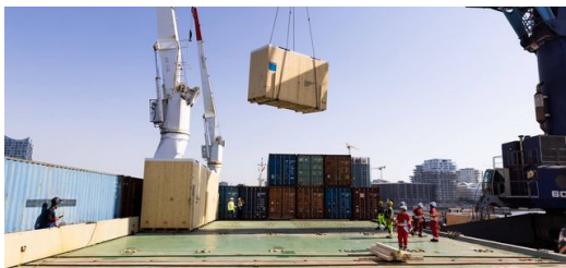
Schwerlastkräne beladen das Schiff mit 49 Laserschneidmaschinen und Produktionsteilen.

2021 hatten in den USA bereits Konzerne wie Coca Cola, Walmart und Ikea eigene Schiffe gemietet.