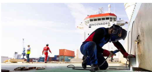
TRUMPF ist eines der ersten Industrieunternehmen Deutschlands, das ein