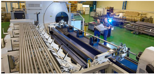
Im 3-D-CAD-System von TRUMPF stehen zahlreiche Konstruktionshilfen für Rohre und Profile bereits automatisch zur Verfügung. Mit Eigenlösungen für außergewöhnlich komplexe Konstruktionen bietet ProfilaseRichter auch Leistungen ganz außerhalb des regulären Standards.