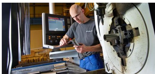
Täglich sind ein bis zwei Programmierer mit der Vorbereitung von zwei Schichten beschäftigt. Die Software TruTops Tube ermöglicht die exakte Berechnung von Schnittgeometrien.