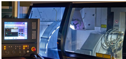
Die Rohrspezialisten von ProfilaseRichter haben mit der TruLaser Tube 7000 Möglichkeiten, die viele Kunden noch gar nicht kennen, beispielsweise Knickverbindungen oder auch Positionierhilfen mit Zapfen und Durchbrüchen, die die Montage erleichtern. Durch die Automatisierung der Maschine verringern sich die Durchlaufzeiten und ermöglichen schnelle Lieferungen.

Wir haben die Schweißnahterkennung, die sich beim automatischen Abarbeiten höherer Stückzahlen bezahlt macht und die adaptive Spanntechnik zur Bearbeitung offener Profile. Ein großes Thema ist auch die Minimierung von Schlackespritzern in Rundprofilen, die wir mit der Spritzschutz-Vorrichtung erreichen. Für die prozesssichere Beladung sorgt ein LoadMaster und die kratzerarme Bearbeitung ist selbstverständlich.