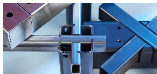
Die TruLaser Tube 7000 schneidet Rohre und Profile mit bis zu 254 Millimeter Hüllkreisdurchmesser. Die komplexe Eckenberechnung rechteckiger Profile leistet die Software TruTops Tube automatisch.