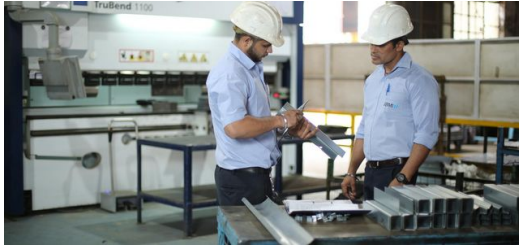
Qualität garantiert: Ingenieure bei JBM inspizieren die Bauteile, die mit der Abkantpresse TruBend 1100 hergestellt wurden.