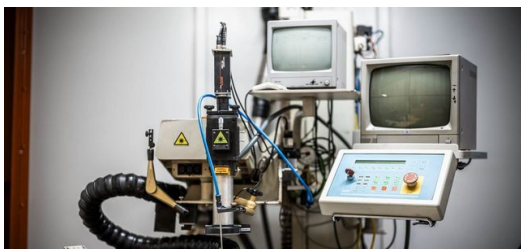
Was überzeugt, bleibt im Einsatz. Gleichzeitig investiert BBW Lasertechnik regelmäßig in die aktuellsten Laseranlagen auf dem Markt und erweitert sein Portfolio stetig.