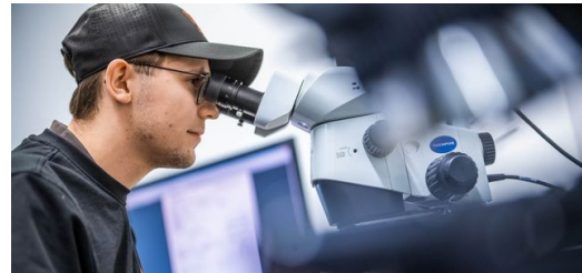
Unermüdlich am Verbessern und Erforschen — das macht Kunden glücklich und wurde 2023 mit dem Bayerns Best 50 Award prämiert.