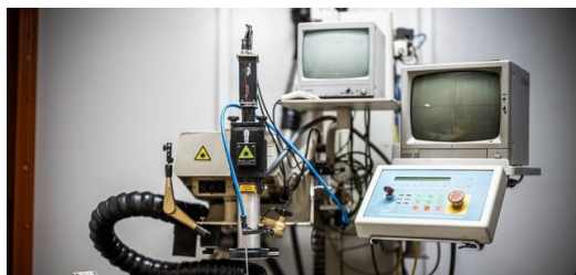
Was überzeugt, bleibt im Einsatz. Gleichzeitig investiert BBW Lasertechnik regelmäßig in die aktuellsten Laseranlagen auf dem Markt und erweitert sein Portfolio stetig.