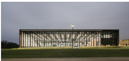
Die Smart Factory von TRUMPF in Chicago, USA.

Ginge Prouvé durch die 2017 eröffnete TRUMPF Smart Factory in Chicago, schließe sein Herz sicher höher: Das 45 mal 55 Meter große, freitragende Hallendach in dieser vollständig vernetzten Fabrik ruht auf elf aus Einzelstücken geschweißten Stahlträgern. Sie wurden allesamt auf hauseigenen Maschinen geschnitten. Nicht nur fiktive Besucher wie Prouvé können so sofort sehen, was die Maschinen in der Smart Factory leisten – und erahnen, was Lasermaschinen überhaupt für die Architektur leisten. Ziemlich sicher würde Prouvé seinen Fachkollegen Frank Barkow aus dem Architekturbüro Barkow Leibinger, das die Smart Factory für TRUMPF entwarf, zuallererst fragen, wie unermesslich hoch ihr Budget für das Gebäude war, dass sie derartige Konstruktionen einplanen konnten. Und er würde erfahren: gar nicht so hoch. Denn Lasermaschinen von TRUMPF haben die Stahlträger geschnitten und geschweißt und die Dachkonstruktion erschwinglich gemacht.