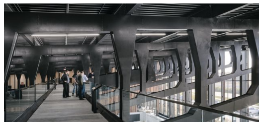
Elf Stahlprofile, aus Einzelstücken geschweißt, tragen das Dach der Produktionshalle der TRUMPF Smart Factory in Chicago, USA.