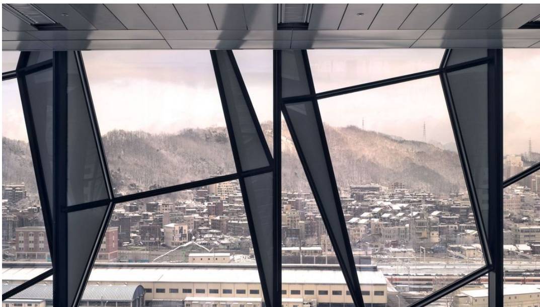
TRUTEC Building in Seoul, Korea.

Wie also bekommt Montanstahl die heiß begehrten scharfen Kanten bei großen Stahlprofilen hin? Beispiel scharfkantige Rechteckhohlprofile: Sie sind als Trägerstruktur für Fassaden beliebt. Konventionell entstehen sie, indem Metallbauer einen Blechstreifen zum Viereck biegen und auf einer Seite schweißen. Der Nachteil beim Biegen zeigt sich an den Außenradien, für die die altbekannte Faustregel gilt: zweimal Materialstärke. Bei Profilen mit 20 Millimeter Wandstärke bekommt man also einen Außenradius von 40 Millimetern – das sind dann keine Rechteckhohlprofile mehr, sondern irgendetwas Eiförmiges. Alternativ kann man auch vier Blechstreifen nehmen und an allen Seiten schweißen. Das hat den zusätzlichen Charme, dass man verschiedene, genau an die Statik angepasste Materialstärken verwenden und somit Stahl sparen kann. Der Haken: Die Vierblechmethode ist extrem teuer und zeitaufwendig. Es sei denn, man macht es wie Montanstahl und setzt auf schnelle, tiefe und hoch belastbare Laserschweißnähte. Damit werden scharfkantige Rechteckhohlprofile so wirtschaftlich, dass sie für immer mehr Bauvorhaben überhaupt erst infrage kommen.