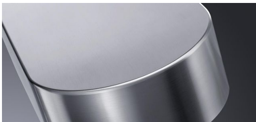
Besonders wenn höchste Ansprüche an die Qualität der Nähte gestellt werden, punktet das Laserschweißen.