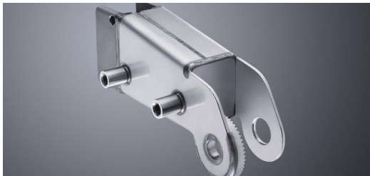
<p> TRUMPF Medizin Systeme setzt in der OP-Tisch-Fertigung auf die Pluspunkte vom Laserschweißen.</p>