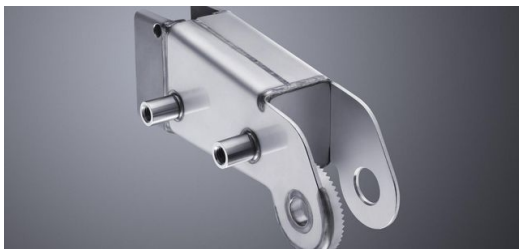
TRUMPF Medizin Systeme setzt in der OP-Tisch-Fertigung auf die Pluspunkte vom Laserschweißen.

Wie man die richtigen Parameter für das eigentliche Laserschweißen findet, vermittelt ein weiteres Trainingsmodul. TRUMPF Experte Nikolaus Wagner: „Verbindliche Parameter wie in den Technologietabellen für das 2-D-Laserschneiden erlaubt die Komplexität im Schweißen nicht. Wir haben jedoch für ganz viele Anwendungen Korridore und Zielwerte dokumentiert, die dem Anwender in der Praxis ganz konkrete Hilfestellungen geben. Und schnell zum Gutteil führen.“