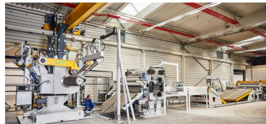
Zusätzlich zur TRUMPF VarioPress 500 hat Wagner auch in eine neue Abcoilanlage investiert.

Um alle diese Materialien auch schon ab Losgröße 1 optimal zu verarbeiten, hat Wagner seine neue TRUMPF VarioPress 500 mit zahlreichen Extras versehen, die die beste Fertigungsqualität gewährleisten. So ist beispielsweise das Hinteranschlagsystem mit Biegehilfen und einer Hochhalteeinrichtung gekoppelt, die CNC-gesteuert zum Einsatz kommen. Zusammen mit den