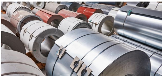
Um alle Kunden innerhalb von 48 Stunden beliefern zu können, hält Wagner ein großes Materiallager vor. Neben Stahlblech von 0,75 bis fünf Millimeter Dicke verarbeitet die Firma auch verzinktes Stahlblech, Alu, Titanzink, Kupfer und Edelstahl.