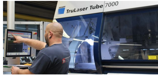
Der Maschinenbediener bekommt das fertige Programm auf sein Terminal, um das Gewinde ins Rohr zu schneiden.