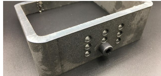
Mit der TruLaser Tube 7000 lassen sich verschiedene Gewinde einbringen.