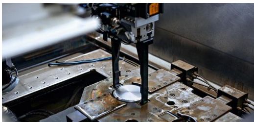
Jeder Rohling ist seit 2015 mit einem sogenannten Data-Matrix-Code versehen.