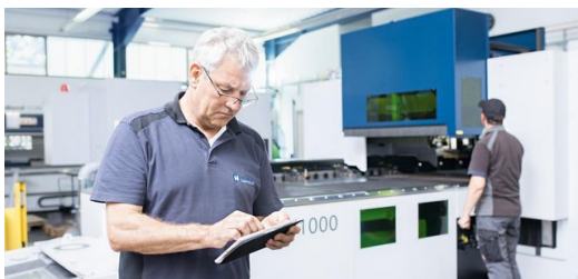
Bestellung: Das Online-Ordern ist zum Standard geworden.

Die Beschriftung hilft beim Kommissionieren und Versenden, dem letzten Schritt. Und auch der funktioniert weitgehend von alleine. Die zuständigen Mitarbeiter werden benachrichtigt, sobald ein Auftrag vollständig ist, also alle bestellten Artikel bereitstehen. Durch die intelligente Vernetzung können bis 14 Uhr bestellte Standardwerkzeuge noch am selben Tag verschickt werden. Der Prozess ist mit einer Liefertreue von 98 Prozent äußerst zuverlässig. Nachdem der Speditionsleister das Stanzwerkzeug abgeholt hat, geht es auf direktem Weg zum Kunden.