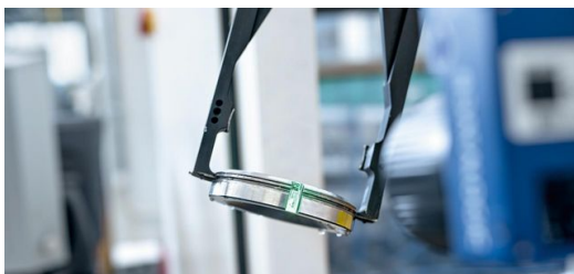
Der Data-Matrix-Code hilft dabei Prozesse zu standardisieren.