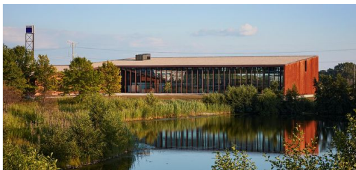
Der Standort Chicago ist für die Smart Factory von TRUMPF wie geschaffen. Rund 40 Prozent der blechbearbeitenden Industrie in den USA befinden sich in den direkt umliegenden Staaten.

„In Chicago erleben unsere Kunden einen vernetzten Maschinenpark, mit dessen Hilfe sich Aufträge automatisiert abarbeiten lassen. Kern der Smart Factory bildet eine verkettete Anlage, bei der mehrere Maschinen an ein STOPA Hochregallager angeschlossen sind. Digitale Lösungen steuern den gesamten Produktionsprozess und sorgen jederzeit für Transparenz, zum Beispiel über den Auftragsstatus oder den Materialbestand. Auf den Punkt gebracht: In Chicago zeigen wir unseren Kunden live, wie sie von digital vernetzten Fertigungslösungen profitieren können und wie die Blechbearbeitung der Zukunft aussieht.“