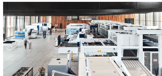
In einer 55 Meter langen Produktionshalle befindet sich eine verkettete Blechfertigung mit einem Hochregallager als Herzstück, das die daran angebundenen Werkzeugmaschinen mit Material versorgt.