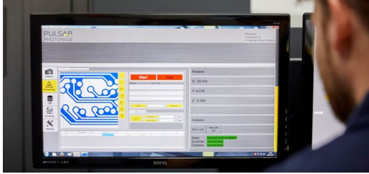
Die Maschinensoftware Photonic Elements zeigt die Abtraggeometrie, die während des Prozesses ausgeführt wird.

kann nicht Spezialist für jede am Gesamtprozess beteiligte Maschine sein.“