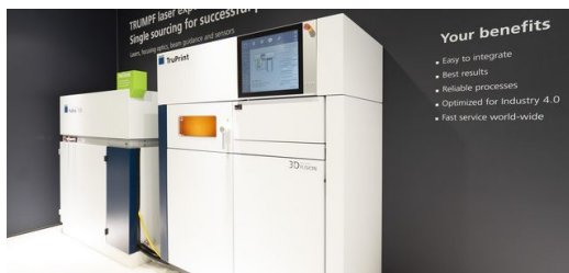
Mit einem neuen grünen Laser druckt TRUMPF Kupfer und Gold

Außerdem hat TRUMPF auf der Formnext mit einem grünen Laser erstmals Reinkupfer und Gold gedruckt. Dazu haben die Entwickler den neuen Scheibenlaser TruDisk 1020 an den 3D-Drucker TruPrint 1000 angebunden. Dessen Wellenlänge liegt im grünen Bereich und kann - anders als Infrarotlaser - stark reflektierende Werkstoffe wie Reinkupfer und Gold schweißen. Wer profitiert davon? Die Schmuckindustrie, weil sie kein teures Material verschwendet. Auch die Elektronikbranche und die Automobilindustrie können Bauteile aus Reinkupfer gut gebrauchen. Schließlich ist das Material ein ausgezeichneter Strom- und Wärmeleiter.