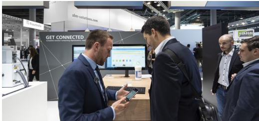
Alle 3D-Drucker des Messestands sind an ein digitales MES angebunden.

Ein weiteres Highlight am TRUMPF Stand war der Digitalisierungsshowcase. Besucher erlebten, wie sich die Prozesskette im 3D-Druck vollständig digital abwickeln lässt. Dafür hat TRUMPF alle 3D-Drucker des Messestands an ein Fertigungsmanagementsystem (MES) und eine intelligente Bestellplattform angebunden. Der Anwender lädt die Daten seines Bauteils hoch und erfährt sofort, was sein Auftrag kostet und wie lange die Lieferung dauert. Aber das ist noch nicht alles. Auch der Hersteller kann auf die Prozessdaten der Drucker und die anstehenden Aufträge zuzugreifen. Und zwar von jedem beliebigen Standpunkt aus und in Echtzeit.