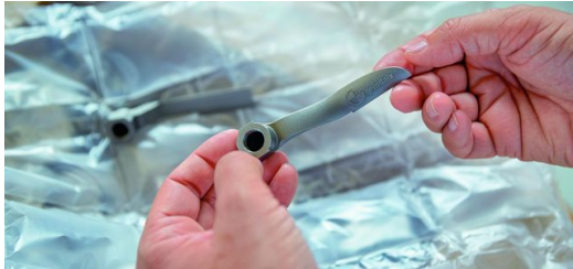
Aus einem Guss: Weich geschwungen und ohne harte Übergänge kommt die von Bionic Production überarbeitete Düsenkonstruktion aus dem 3D-Drucker.

Effizient ist die neue Düse in vielerlei Hinsicht. Sie ist strömungsoptimiert, wodurch sich die Druckverluste um bis zu 20 Prozent reduzieren ließen. Für eine vorgegebene Austrittsgeschwindigkeit des Kühlschmiermittels wird weniger Druck und damit weniger Energie benötigt. Die geschwungenen Kanäle und die optimierte Strahlführung bringen den Kühlschmierstoff zudem exakt dorthin, wo er gebraucht wird, und zwar nur in der Menge, die notwendig ist, damit der Prozess optimal und ohne thermische Beschädigung des Bauteils durchgeführt werden kann. Eine Verlangsamung des Fertigungsverfahrens ist aufgrund der sicheren automatisierten KKS-Einbringung kein Thema mehr.