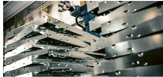
Perfekt aufeinander abgestimmte Prozesse erhöhen die Durchlaufgeschwindigkeiten und garantieren eine optimierte Liefertreue.