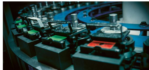
Der automatisierte Werkzeugwechsler garantiert Effizienz.