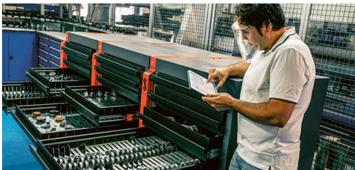
Ein umfangreiches Sortiment an Werkzeugen lässt beim Stanzen Raum für neue Ideen.