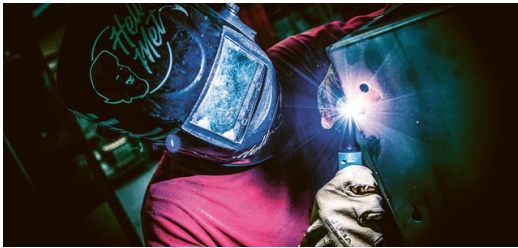
Auf 7000 Quadratmetern bietet Ripleg die komplette Prozesskette Blech. Neben Laserschneiden und Stanzen gehören auch Biegen, Schweißen, Lackieren und die Endmontage fertiger Produkte zum Portfolio.