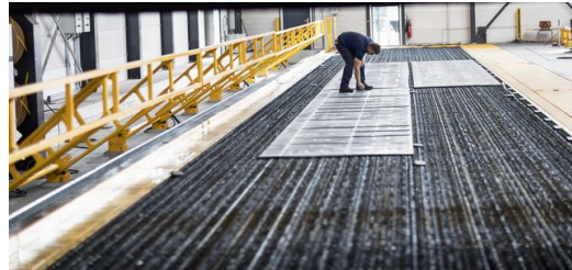
Da der Tisch der Laseranlage ist ebenerdig ist, lassen sich die Bleche gut und einfach einbringen (Bilder: Norbert Voskens).

unabhängig schneiden (Bilder: Norbert Voskens).