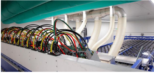
Laserlichtleitungen verbinden die Optiken mit den Lasern.