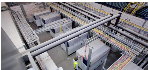
Zwölf Hochleistungslaser erzeugen 144 Kilowatt Leistung.