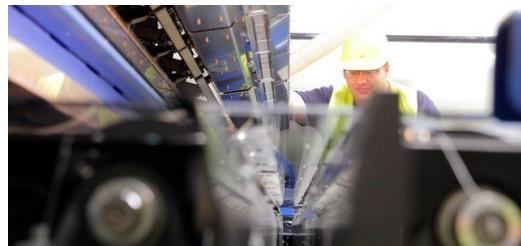
Strahlfallen befinden sich oberhalb und unterhalb der Laserlinie.