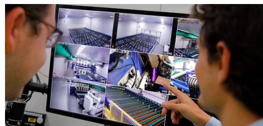
Ein hoher, aber nur sehr kurzer Wärmeeintrag ist für das Härten der Glasbeschichtung essenziell. Über fünf Jahre tüftelten die Glasexperten von Saint-Gobain am Rapid-Thermal-Processing Verfahren.

Diese Anlage auch industrietauglich zu machen, erwies sich allerdings technisch als undurchführbar. „Wir wandten uns an den Reutlinger Hightech-Maschinenbauer Manz“, erzählt Lorenzo Canova. Die Experten dort brachten TRUMPF ins Spiel und eine vierjährige Entwicklungspartnerschaft nahm ihren Anfang.