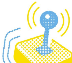
Die Fernsteuerung fühlt sich einfach nur okay an. - Gernot Walter

Was fühlt die Maus dabei? Fühlt sie sich fremdbestimmt oder denkt sie, sie wolle jetzt im Kreis rennen?