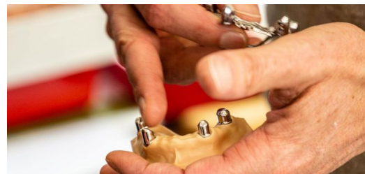
Die Primärteile (unten) werden auf vorhandene und präparierte Zahnstümpfe zementiert. Das Sekundärteil (oben) ist verbunden mit Schienen für die Ersatzzähne und wird auf die Primärteile aufgesetzt.