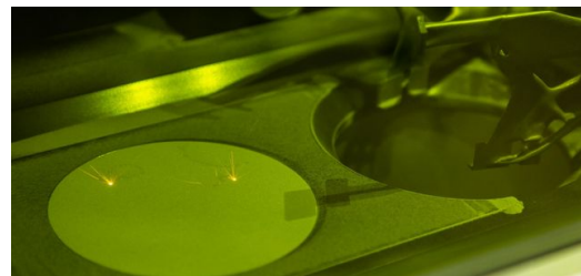
Die TruPrint 1000 von TRUMPF erfüllt mit ihrem pulsierenden Laser auch hohe Ansprüche an die Oberflächenqualität. Dank Multilaser-Technologie fertigt sie außerdem sehr produktiv.