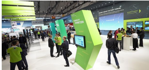
Dank der grünen T-Shirts der TruConnect Berater wurden Besucher, die Fragen zu den TRUMPF Lösungen für die Smart Factory hatten, schnell fündig.