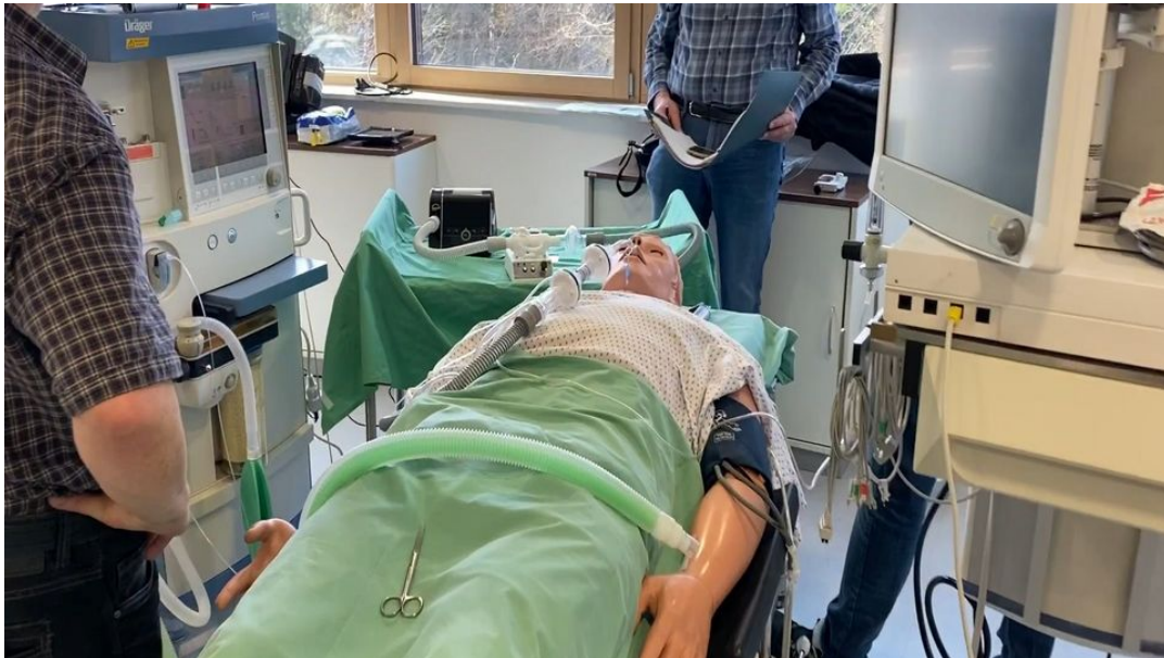
Forscher und Mediziner der Universität Marburg testen das Beatmungsgerät an einer Puppe.