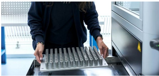
Die Automatisierungszelle ist mit vier Schubladen ausgestattet. 960 Bauteile haben darin Platz. Sie werden parallel zum Schweißprozess be- und entladen.