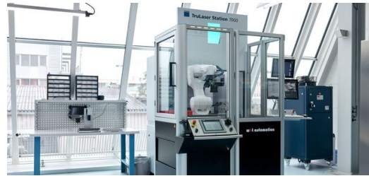
Effizientes Duo: Am schweizerischen Standort Widnau schweißt der Endoskop-Hersteller Karl Storz Okulare auf einer TruLaser Station 7000. Eine mobile Roboterzelle übernimmt das Be- und Entladen der Bauteile.