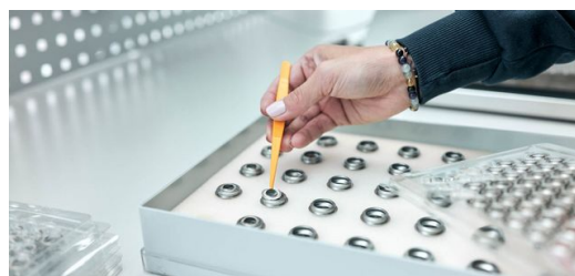
Vorbereitung für den Schweißprozess: Das Platzieren der Linsen auf den Edelstahlhülsen ist nach wie vor Handarbeit.