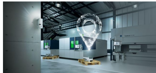
So können Blechfertiger Aufträge, Ladungsträger und Transportmittel nachverfolgen und dadurch Prozesse optimieren.