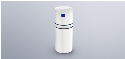
Satellit: Die in der Halle angebrachten Satelliten empfangen den Standort der Marker und übermitteln die Information an einen Industrierechner.