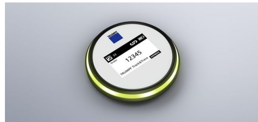
Marker: Nutzer können die Auftragsnummer und weitere Informationen digital auf das E-Ink-Display des Markers übertragen. Danach platzieren sie ihn einfach auf oder neben den Teilen des Auftrags.