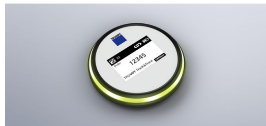
Marker: Nutzer können die Auftragsnummer und weitere Informationen digital auf das E-Ink-Display des Markers übertragen. Danach platzieren sie ihn einfach auf oder neben den Teilen des Auftrags.