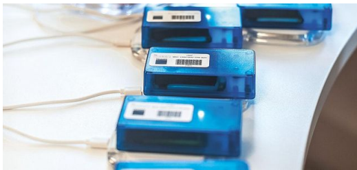
Prototyp: So sahen die Marker während der Testphase aus.