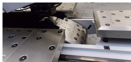
<p>Vorher und Nachher: Altmaschine von TRUMPF nach der Überarbeitung.</p>