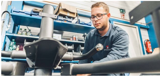
<p>Das Gestänge eines EGYM-Fitnessgeräts besteht aus überwiegend ovalen Stahlrohren. Nach der Bearbeitung auf einer TRUMPF Laser-Rohrschneidemaschine bekommt es durch Pulverbeschichtung ein edles dunkelgraues Finish.</p>

unser fundiertes Know-how im Bereich Laser-Rohrschneiden ganz besonders geholfen.“ Das Gestänge des Geräterahmens besteht zu 70 Prozent aus optisch attraktiven Ovalrohren aus stabilem Baustahl. „Wir setzen zur Bearbeitung sowohl unsere TruLaser Tube 5000 als auch unsere TruLaser Tube 7000 ein. Beide sind mit der Option Schrägschnitt ausgestattet und können Gewinde einbringen.“ Was bei der konventionellen Fertigung nur in mehreren Arbeitsschritten umsetzbar wäre, schaffen die Laser-Rohrschneidmaschinen von TRUMPF in nur einem Arbeitsgang. Das Riffelblech aus Aluminium zum Abstellen der Füße kommt kratzerfrei aus der TruMatic 7000 , die erforderliche Biegekante zur Befestigung am Rahmen erledigt die TruBend 7036 Cell . Die Elektronik sowie einige Kunststoffteile werden Steinhart zugeliefert. Nach der Pulverbeschichtung der Rahmen erfolgt die Montage aller Komponenten zu kompletten Einheiten.